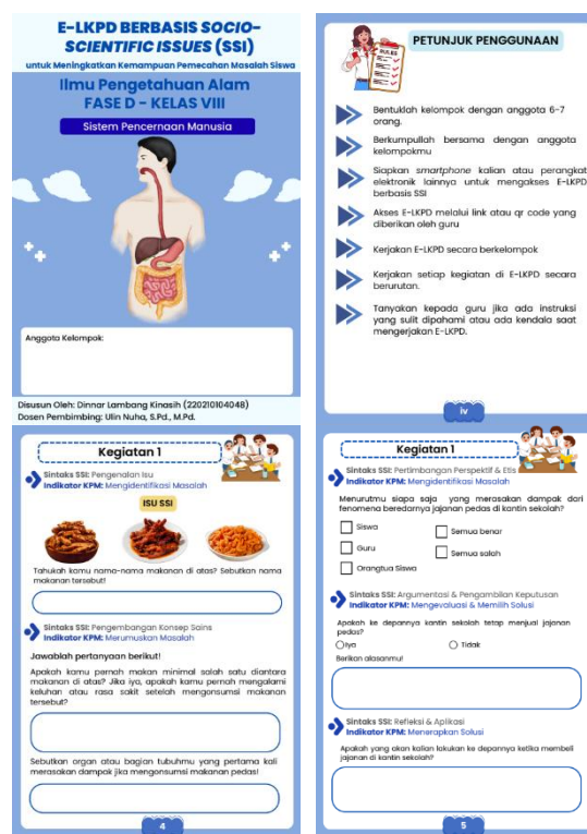
Gambar 2. Tampilan E-LKPD berbasis SSI

dalam kegiatan pembelajaran. Perancangan E-LKPD berbasis SSI ini disesuaikan dengan hasil analisis yang telah dilakukan sebelumnya meliputi karakteristik siswa, tujuan pembelajaran, dan kompetensi yang ingin dicapai yaitu meningkatkan kemampuan pemecahan masalah siswa. E-LKPD berbasis SSI yang dirancang juga disesuaikan dengan sintaks model pembelajaran SSI yakni pengenalan isu, pengembangan konsep sains, pertimbangan perspektif dan etis, argumentasi dan pengambilan keputusan, serta refleksi dan aplikasi. Adapun untuk selanjutnya rancangan produk awal disusun menggunakan dua tahap yaitu penyusunan E-LKPD berbasis SSI menggunakan canva dan liveworksheets . Adapun untuk hasil dari rancangan produk dapat diamati pada gambar berikut.