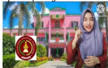
Gambar 5. Penutup dalam Media Video Pembelajaran

Tampilan pada penutup pembelajaran ditunjukkan pada gambar berikut: