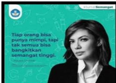
Gambar 7. Tampilan Motivasi Belajar