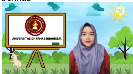
Gambar 2. Layar Depan Video Pembelajaran

Layar depan video ini terdiri atas 4 layar, layar depan pertama tersebut menerangkan identitas peneliti yang dilakukan, yaitu nama peneliti, semester berapa, prodi dan asal kampus. Layar kedua yaitu menunjukkan nama pembimbing. Layar ketiga yaitu menunjukkan nama validator. Layar keempat menerangkan pembelajaran yang akan dilakukan, yaitu pembelajaran IPAS BAB 1 tumbuhan sumber kehidupan di bumi pada topik A yaitu bagian tubuh tumbuhan. Layar depan media video tersebut dapat dilihat pada gambar berikut: