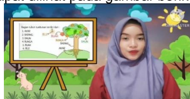
Gambar 4. Tampilan Materi Pembelajaran

Materi pada video pembelajaran disesuaikan dengan masing-masing kegiatan pembelajaran yang ditetapkan. Pada kegiatan ini materi yang disajikan antara lain pengertian, manfaat, tujuan, manfaat, ciri - ciri, contoh, serta langkah-langkah. berikut cuplikan materi bagian tubuh tumbuhan dapat dilihat pada gambar berikut.