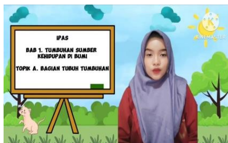
Gambar 3. Materi yang Akan Dipelajari

Tampilan materi yang akan dipelajari menggambarkan Topik A Bagian Tubuh Tumbuhan sebagai berikut: