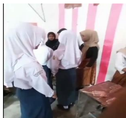
Gambar 1. Kegiatan Market Day

Proyek kewirausahaan ini tidak hanya bertujuan untuk mengembangkan peserta didik menjadi pembelajar yang mandiri dan imajinatif sejalan dengan ciri profil pelajar Pancasila. Selain itu, tujuan dari aktivitas ini adalah untuk meningkatkan pemahaman peserta didik tentang materi aritmatika. Peserta didik diminta untuk membuat barang yang akan dipasarkan, memproyeksikan biaya produksi, dan menghitung harga produk untuk menghasilkan keuntungan. Untuk memproduksi barang dan