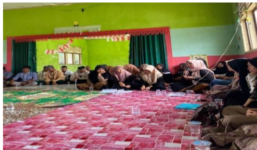
Gambar 2. Sesi Diskusi Dan Tanya-Jawab

Setelah seminar motivasi ini dilanjutkan dengan diskusi dan tanya – jawab terkait persoalan yang dihadapi oleh kalangan remaja saat ini. Diantara permasalahan yang mereka hadapi adalah kesulitan dalam pembiayaan kuliah. Kami sebagai tim pengabdian menyadari akan hal tersebut dan memberikan solusi diantaranya dengan meraih dan mencari beasiswa misalnya beasiswa bidikmisi, beasiswa prestasi, beasiswa daerah atau dengan Kartu Indonesia Pintar. Semua hal ini bisa dicari dengan sering-sering melihat informasi di media social dan sering bertanya dengan teman-teman yang pernah mendapatkannya.