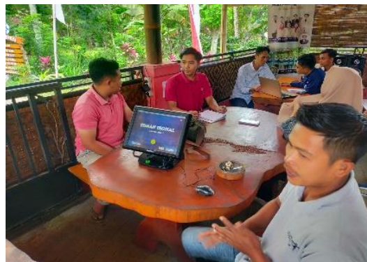
Gambar 4. Sosialisasi dan Pretest Kemampuan Penguasaan Teknologi Informasi Calon Admin Rumah Digital Gombengsari