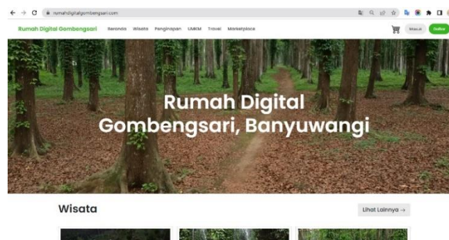
Gambar 1. Halaman Website Rumah Digital Gombengsari

Pokdarwis Gombengsari sebagai koordinator pelaku wisata, umkm, biro perjalanan dan penginapan di Gombengsari sekaligus admin dari website rumah digital gombengsari. Kurangnya pengetahuan tentang teknologi dan informasi menyebabkan website rumah digital gombengsari tidak pernah di update kendalanya SDM Pokdarwis Gombengsari kurang memahami cara penggunaan dan mengoperasikan web admin rumah digital gombengsari. Padahal perkembangan teknologi informasi yang semakin hari semakin pesat berdampak pada perilaku banyak orang yaitu untuk dapat memenuhi kebutuhan informasi yang lebih cepat dan murah tentunya, selain itu menuntut juga para pemberi informasi untuk memiliki media online , dimana informasi yang disajikan bisa dengan cepat didapatkan oleh konsumen (Yulida et al., 2020).