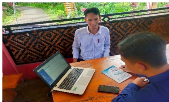
Gambar 5. Pelatihan dan Praktik Penggunaan Admin Web Rumah Digital Gombengsari