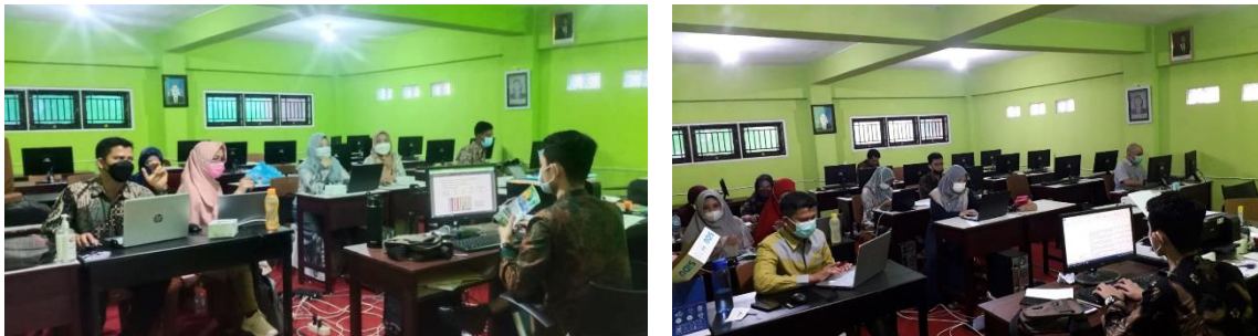
Gambar 1. Pelaksanaan Pelatihan

Observasi (pengamatan) dilakukan Tim pelaksana terhadap peserta pelatihan dilakukan sejak awal sampai akhir kegiatan. Dalam kegiatan ini yang menjadi observer adalah TIM pelaksana dibantu dengan mahasiswa dengan menggunakan lembar observasi. Kategori pengamatan yang dicatat memuat aspek-aspek sebagai berikut : Aktivitas Peserta Pelatihan: mendengar atau memperhatikan penjelasan Tim pelaksana, membaca modul petunjuk pembuatan media media berbasis web , bertanya dengan tim pelaksana tentang materi pelatihan, mengerjakan tugas yang diberikan berdiskusi dengan teman dalam mengerjakan tugas yang diberikan dan perilaku yang tidak relevan dengan kegiatan pelatihan (percakapan yang tidak relevan, mengerjakan sesuatu yang tidak relevan dan melamun). Data yang diperoleh dari lembar observasi diberi skor 1 untuk komponen yang tampak dan diberi skor 0 untuk komponen yang tidak tampak.