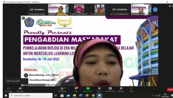
Gambar 1. Pembukaan Kegiatan Pengabdian kepada Masyarakat oleh Ketua Program Studi Pendidikan Biologi FKIP Universitas Muhammadiyah Surakarta

ajar berbasis guided inquiry-TPACK yang dilaksanakan secara daring synchronous menggunakan platform Zoom Meeting (Gambar 1 & 2).