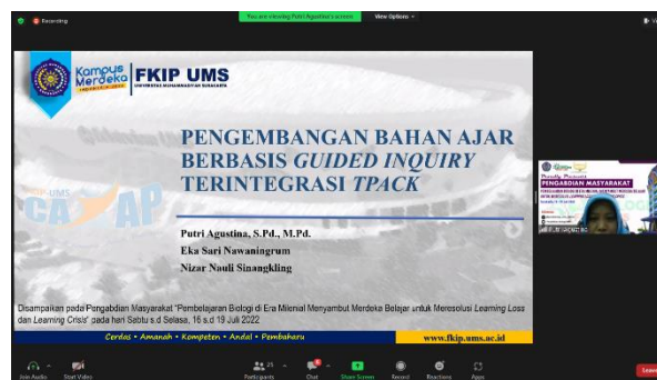
Gambar 2. Pemaparan Materi tentang pengembangan Bahan Ajar Berbasis Guided Inquiry Terintegrasi TPACK

Setelah pemaparan materi pengembangan bahan ajar berbasis guided inquiry-TPACK , kegiatan dilanjutkan dengan pemaparan petunjuk teknis penggunaan platform Schoology . Pada hari kedua, kegiatan dilaksanakan secara asynchronous menggunakan media Schoology yaitu pada forum diskusi pengembangan bahan ajar IPA dan Biologi berbasis guided inquiry-TPACK (Gambar 3).